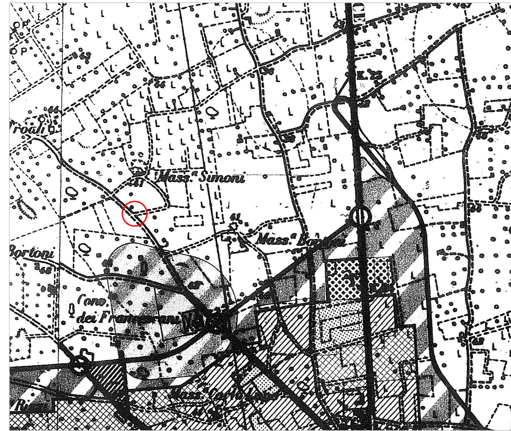
STRALCIO P.R.G. Scala 1:10.000

PLANIMETRIA INQUADRAMENTO URBANISTICO (PRG - PUTT/P - PPTR)