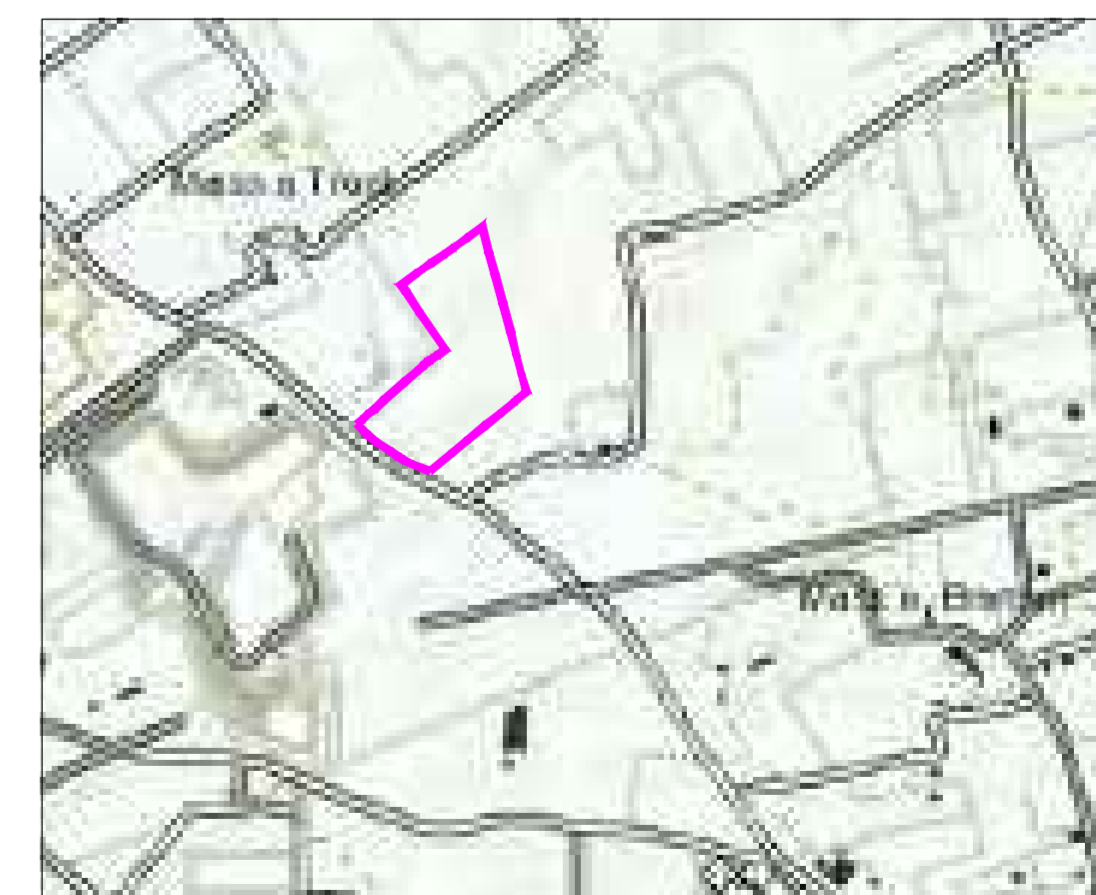
DETTAGLIO - scala 1: 10.000