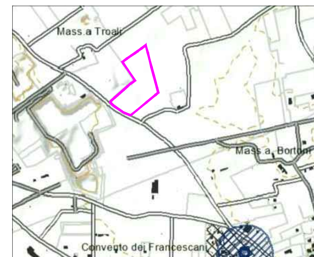
DETTAGLIO - scala 1: 10.000